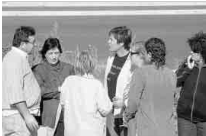
EXPECTACIÓ. Un bon grapat de veïns van aplegar-se al lloc dels fets.