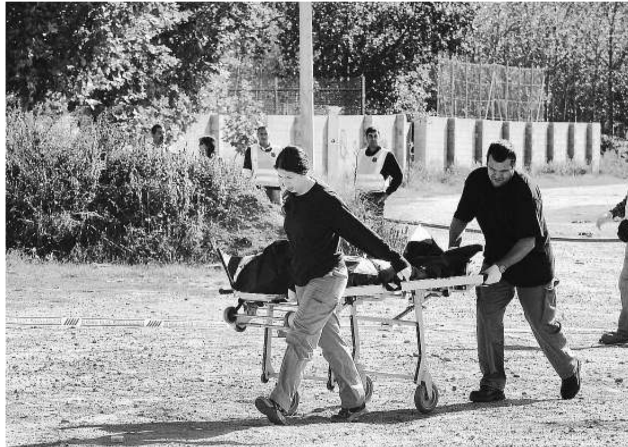
Els treballadors de la funerària s'enduen el cos de la noia, divendres al matí.

Segons tots els indicis, la jove, d'entre 20 i 25 anys, va morir escanyada dijous, i l'agressor va tenir el ca-