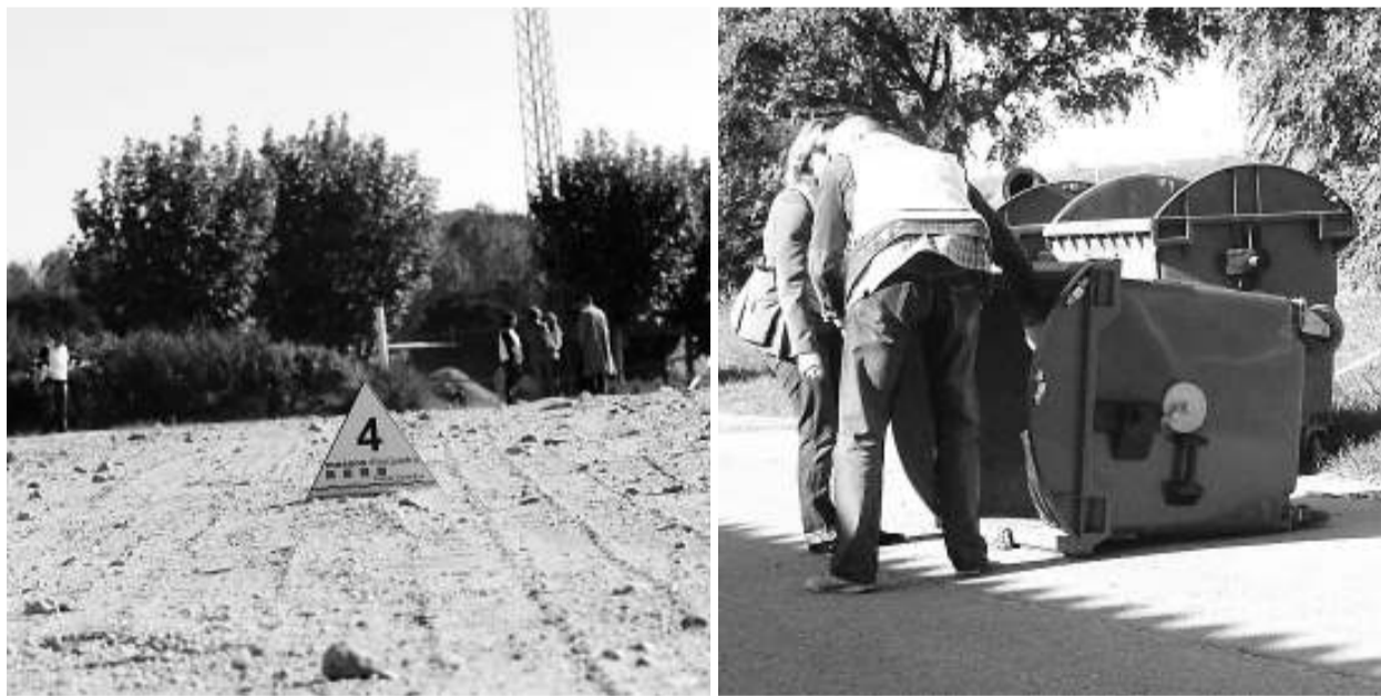
Aixecament del cadàver. L'indici número 4 marca les roderes, i uns agents inspeccionant un contenidor.

ques d'identificació: duia un tatuatge i tres pírcings.