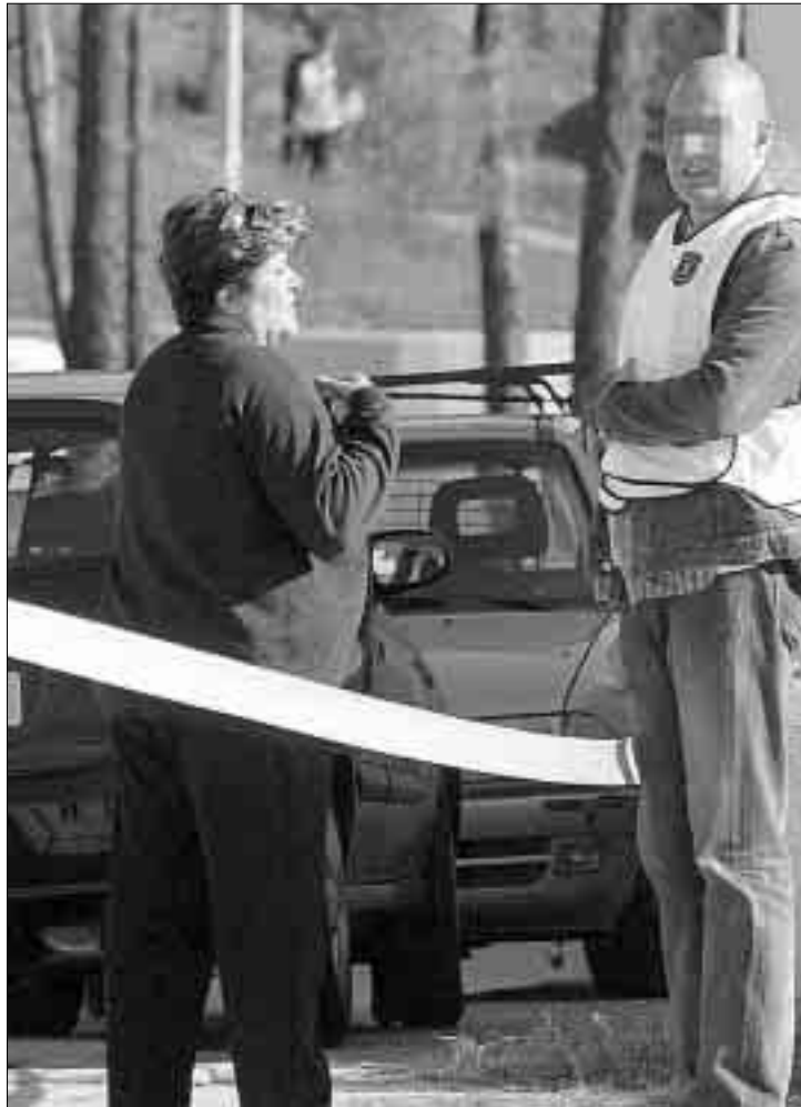
«UN GRAN ENSURT». La dona que va trobar el cadàver xerra amb un mossos.