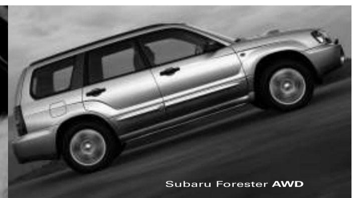
Subaru Forester AWD

Cos i ment en perfecta harmonia. La tècnica més depurada es converteix en intensa emoció. Subaru Forester: sistema simètric de tracció permanent AWD (All Wheel Drive), 195 mm d'alçada lliure al terra, motor bòxer de cilindres oposats, palanca reductora... Mai el control ha estat tan excitant. Gamma Forester, des de 23.775 euros.