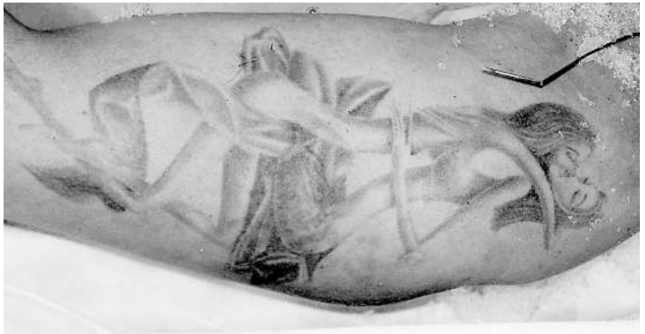
La imatge de dues noies seminues abraçant-se que la noia morta duia tatuada.

► Un foc arrasa una indústria de Mollerussa. Un incendi que hi va haver ahir va destruir totalment les instal·lacions de l'empresa fructícola Nufri de Mollerussa (Pla d'Urgell), que té una superfície de 25.000 metres quadrats. El foc, que va començar per l'explosió d'una cambra frigorífica, no va causar ferits i va obligar a evacuar els treballadors.