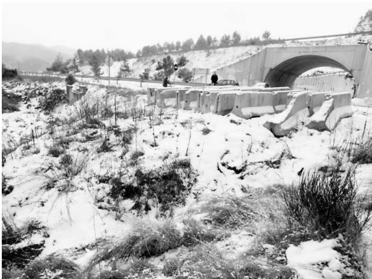
Imatge del barranc nevut on es va descobrir el cos.

vespre de dimarts, el jutjat de guàrdia va fer l'aixecament del cadàver. El jutjat número 4 de Vic, que es va fer càrrec del cas, va ordenar el secret de sumari. La policia científica dels Mossos d'Esquadra està investigant ara la identitat de la jove i les circumstàncies de l'assassinat. Ahir al matí van fer una inspecció ocular per trobar petjades,