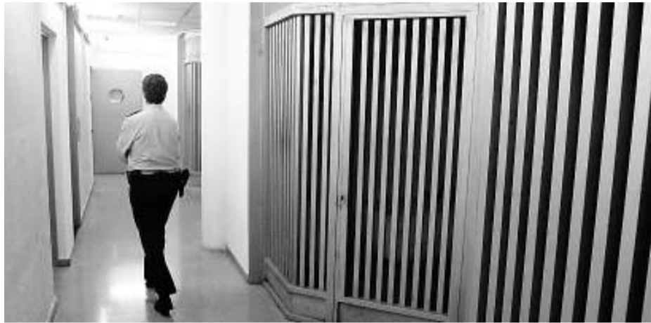
Els calabossos de la comissaria de l'Hospitalet de Llobregat, on hi ha càmeres.

Els dos casos van ser detectats en una investigació de la divisió d'afers interns encarregada pel nou director general de la Poli-